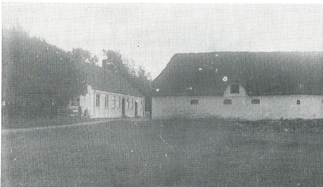
Stårupgård omkring 1920.